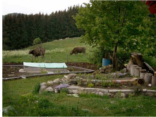
Zur Ruhe kommen und wieder auf das Wesentliche besinnen...

bieten Aufnahmemöglichkeiten für Kinder, Jugendliche und junge Volljährige, die aufgrund ihrer Entwicklungsproblematik in herkömmlichen Betreuungssettings nicht adäquat gefördert werden können. Diese Maßnahmen sind individuell auf den Betreuungsbedarf des Jugendlichen zugeschnittene vollstationäre Hilfen. Sozialpädagogische Fachkräfte nehmen hierbei Jugendliche in ihrem eigenen Lebensumfeld auf. Aus den unterschiedlichsten Lebensentwürfen und fachlichen Schwerpunkten der Pädagogen sowie den verschiedensten räumlichen Settings ergibt sich eine Vielfalt von Angeboten im In- und Ausland. Die Hilfe ist in der Regel auf längere Zeit angelegt. Standorte unserer ISE's sind Oberbayern, Schwaben, Allgäu, Niederbayern sowie Standprojekte im europäischen Ausland (Betreuungsangebot mit derzeit 50 Plätzen).