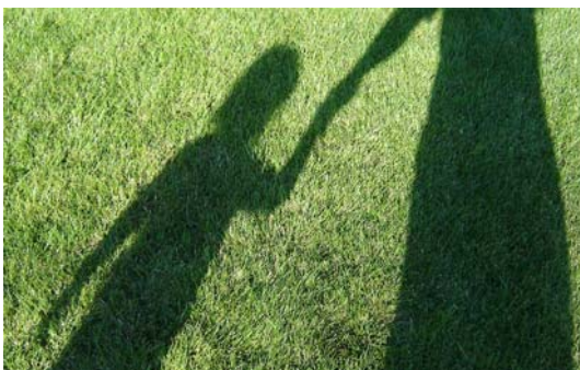
Nur gemeinsam kann Hilfe gelingen

Da wir eine fundierte Angehörigenarbeit anstreben, ist es unserer Auffassung nach unabdingbar, dass im ersten Jahr nach Beginn der Hilfe mindestens zwei ausführliche Familiengespräche durchgeführt werden, in denen die weitere Angehörigenarbeit zielgerichtet abgesteckt wird. Idealerweise finden diese Gespräche im Rahmen eines Hausbesuches sowie eines Besuches der Angehörigen bei uns statt.