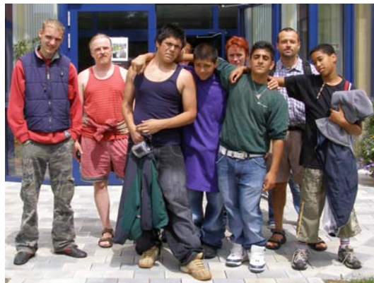
Stolz nach dem Filmdreh zu „Pirates of Herzogsägmühle“