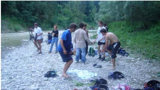
Mit Unterstützung organisieren unsere Jugendlichen regelmäßige Outdoor-Aktivitäten

Unsere Aufnahme- und Klärungsstellen bieten schnelle, flexible und unbürokratische Aufnahmemöglichkeiten - oft an der Schnittstelle zu geschlossener Unterbringung, Psychiatrie und Justiz. Durch inzwischen mehr als 15-jährige Erfahrung und kontinuierlicher Weiterentwicklung verfügen wir über umfassende Kompetenzen, mit den „Schwierigsten“ umzugehen. Unsere Häuser bieten Aufnahmemöglichkeiten für Jugendliche mit gravierenden Verhaltensproblematiken (Lernbehinderung, seelische Behinderung, drohende Verwahrlosung, Schulverweigerung, Delinquenz, Suchtgefährdung, etc.). In einem intensiven Betreuungsrahmen wird den Jugendlichen innerhalb eines klar strukturierten Tagesablaufes und eines festen Regelsystems bei größtmöglicher Individualisierung der äußere Halt geboten, der für ihre Entwicklung notwendig ist. Durch regelmäßig stattfindende Einzelgespräche und ein bewusst gestaltetes Beziehungsangebot gewinnen wir Verständnis für die Biografie und das individuelle Erleben des einzelnen jungen Menschen.