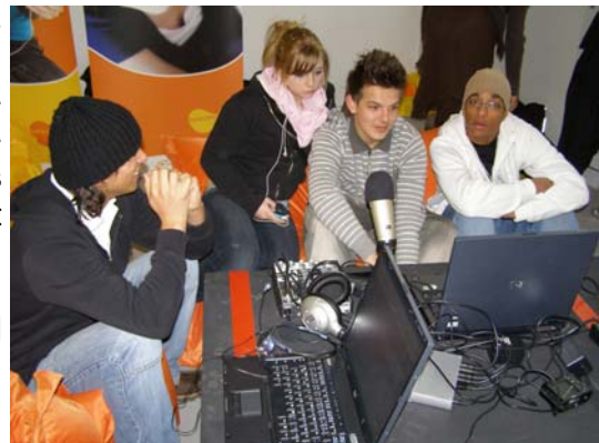
Teilnahme an Multimedia- und Filmwettbewerben hier: Podcast bei „Mediale Bildwelten MB21“

Die aktuelle Lebenswirklichkeit unserer Jugendlichen aufgreifend, bieten wir auch im Bereich der neuen Medien vielfältige Angebote und Workshops zu Podcast, Video, Fotografie und Grafik, Machinimas, Handyclips sowie redaktionelle und gestalterische Arbeit an unserem Jugendportal an.