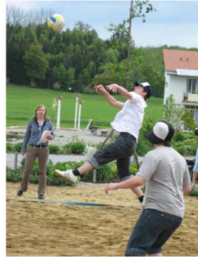
Regelmäßige Sportangebote und Turniere - da ist für jeden etwas dabei

Die Verselbständigungsgruppen bieten benachteiligten und unterstützungsbedürftigen jungen Menschen beiderlei Geschlechts Unterstützung mit dem Ziel der Fähigkeit zu einer eigenverantwortlichen und selbständigen Lebensführung. Die Betreuung berücksichtigt die individuelle Alltagssituation des jungen Menschen und richtet sich in Intensität und Ausgestaltung nach dem jeweiligen Entwicklungsstand und Hilfebedarf. Es bestehen insgesamt Aufnahmemöglichkeiten für 12 junge Menschen in 4 Wohneinheiten; je eine pädagogische Fachkraft pro Kleingruppe.