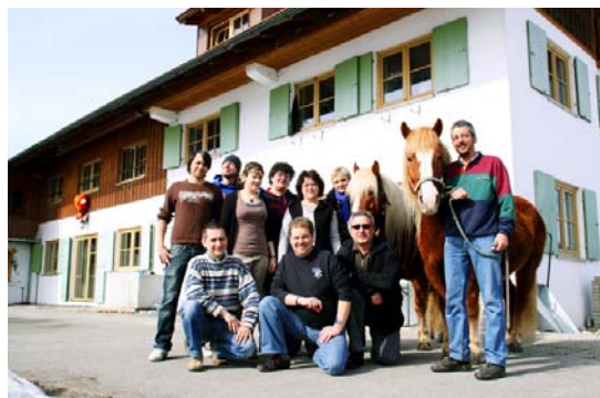
Hofgemeinschaft Nusschale im Allgäu

Großer Bauernhof in Alleinlage im Allgäu mit Tierhaltung und Stallungen; 5 Plätze für männliche junge Menschen im Alter von 12-19 Jahren; pädagogische und psychologische Diagnostik, systemische Familienarbeit, natürliche Tagesstruktur durch Tierhaltung, Förderung der emotionalen Entwicklung im Kontakt mit Tieren, Arbeitstraining und Beschulung; Mitarbeiterzimmer im Haus.