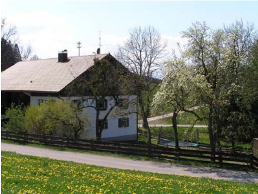
Grundstein in abgelegener, ruhiger Lage

Ehemaliges Bauernhaus mit großer Werkstatt in einem kleinen Weiler bei Steingaden; 5 Plätze für Mädchen im Alter von 12 bis 18 Jahren; heilpädagogische und psychologische Diagnostik, Arbeitstraining, Landschafts- und Gartenbau, Kleintierhaltung, kreative und mädchenspezifische Angebote; Mitarbeiterwohnung im Haus.