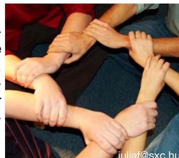
Hilfen gehen bei uns Hand in Hand

Nach einem ersten telefonischen Kontakt mit dem Fachbereich Kinder, Jugendliche und Familien bitten wir die anfragende Stelle um verfügbare schriftliche Unterlagen. Diese dienen dazu, eine Vorauswahl der in Frage kommenden Betreuungsform (z.B. auch die Vorauswahl der geeigneten Wohngruppe, Klärungsstelle, ISE ...) vornehmen zu können.