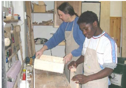
Im Arbeitstraining sammelt man Erfahrungen mit verschiedenen Werkstoffen

Für junge Menschen, die (vorübergehend) nicht schul- oder ausbildungsfähig sind, sich in einer Krise befinden und einer Auszeit bedürfen oder in einer Gruppe „zur Probe“ wohnen, steht die Arbeitstrainingsmaßnahme PHOENIX als arbeitspädagogisches und schulvorbereitendes Angebot zur Verfügung. Ziel ist die Förderung von Arbeits- und Sozialverhalten, die Befähigung und Motivation, die Schul- oder Berufsausbildung wieder aufzunehmen oder Stärken und berufliche Interessen zu entdecken und zu fördern. Es besteht eine enge Kooperation zwischen den Mitarbeitenden von PHOENIX, der Lehrkraft sowie der Schule zur Erziehungshilfe in Herzogsägmühle.