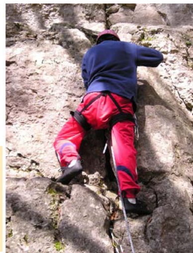
Kletterfreizeiten fördern Mut und Vertrauen

Spezifische Fachkompetenzen: Begleitung im Umgang, beziehungsweise Akzeptanz der psychischen Auffälligkeit; Unterstützung bei der Erarbeitung adäquater Konfliktlösungsstrategien; Begleitung im Alltag, Sexualerziehung; intensive Einzel- und Gruppenarbeit; individuelle Kriseninterventionsmöglichkeiten.