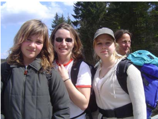
Ausflüge mit der Gruppe

Ehemaliges Bauernhaus mit großer Werkstatt in einem kleinen Weiler bei Steingaden; 5 Plätze für Mädchen im Alter von 12 bis 18 Jahren; heilpädagogische und psychologische Diagnostik, Arbeitstraining, Landschafts- und Gartenbau, Kleintierhaltung, kreative und mädchenspezifische Angebote; Mitarbeiterwohnung im Haus.